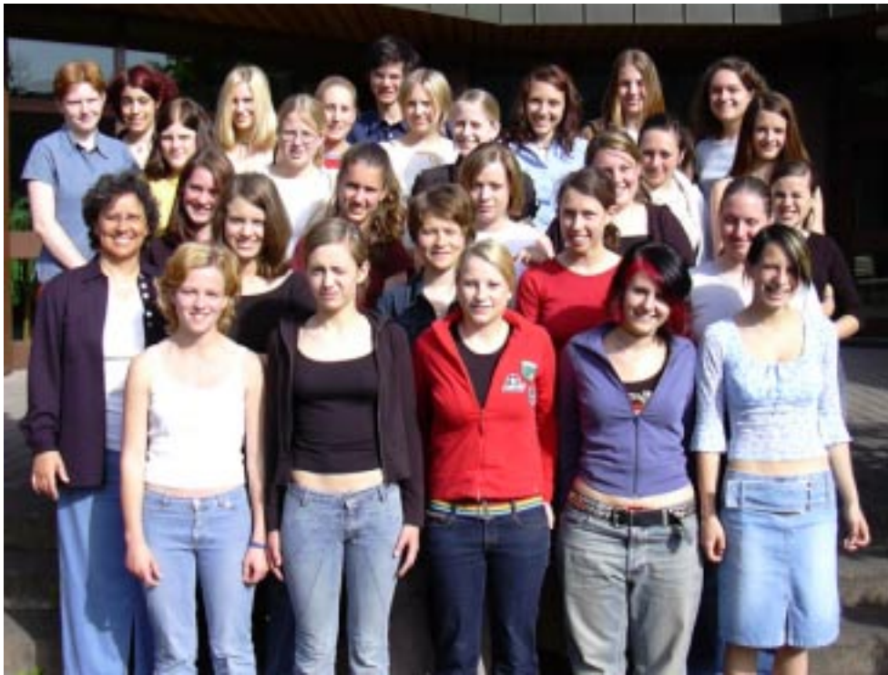
BAKIP Feldkirch Klasse 2a