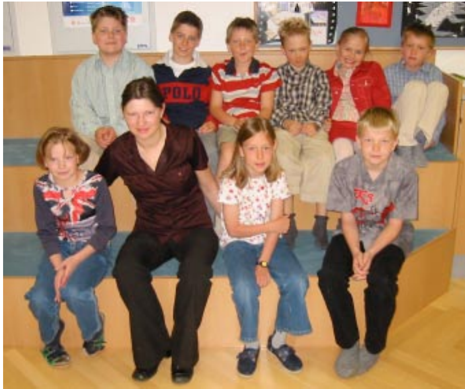
VS Tweng 3. + 4. Stufe