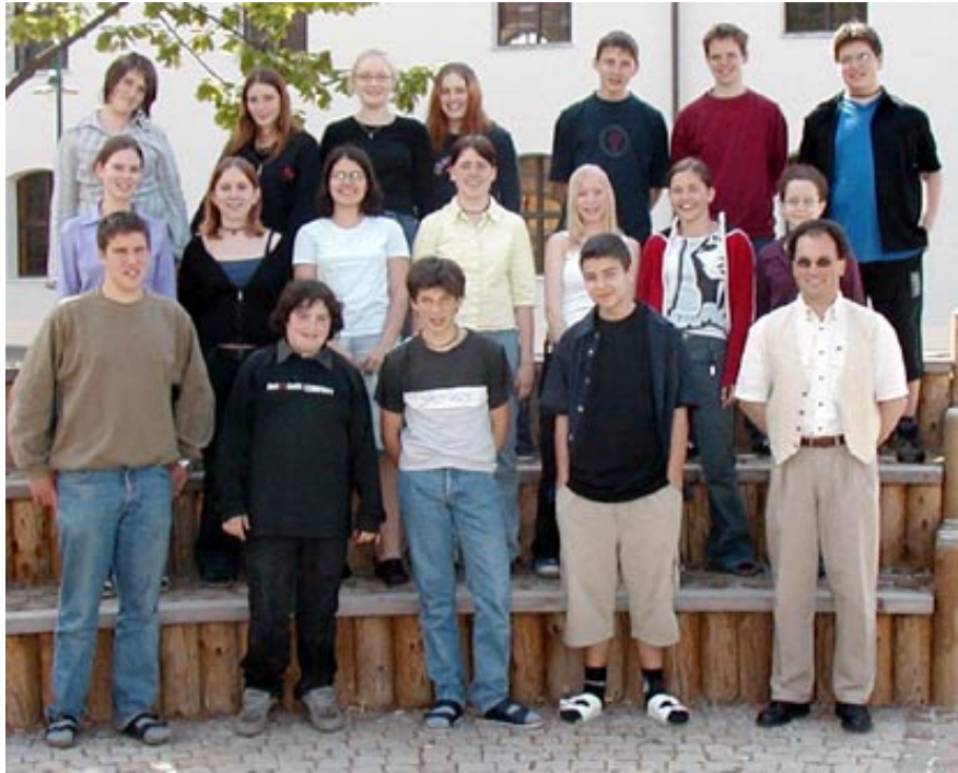
EORG Oberschützen Klasse 5m