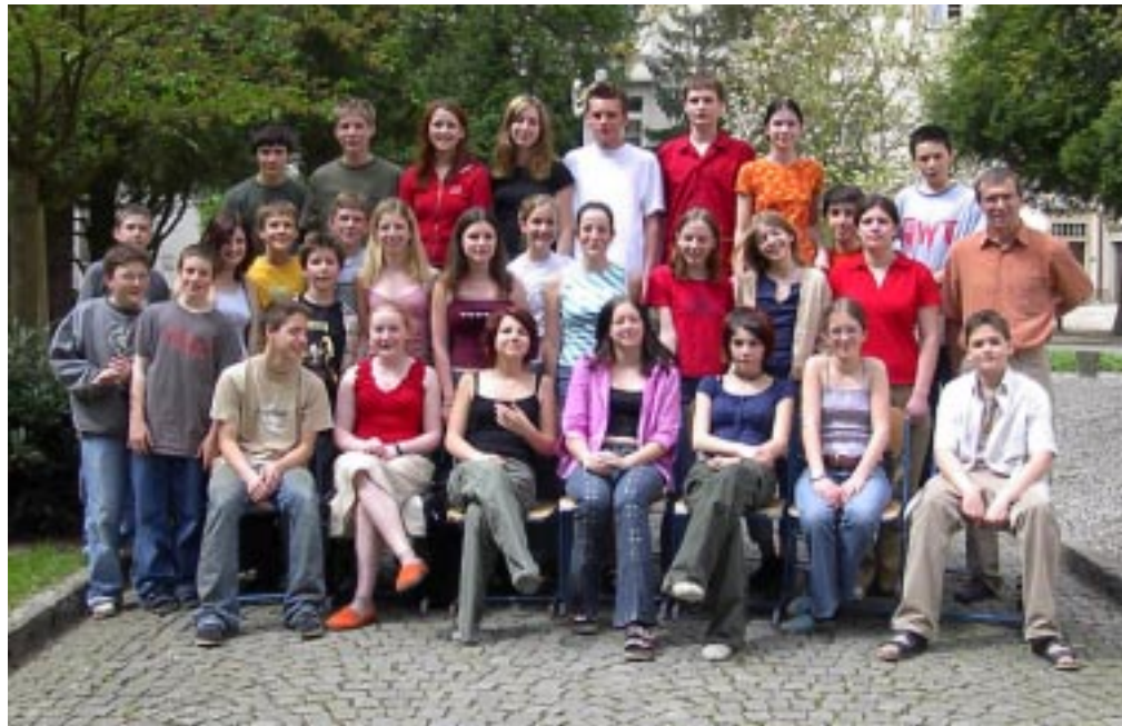
Europagymnasium Baumgartenberg Klasse 4a