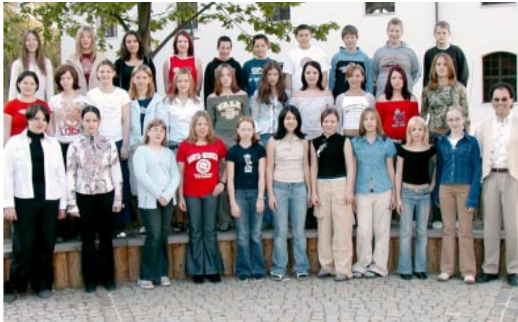
ERG Oberschützen Klasse 3b