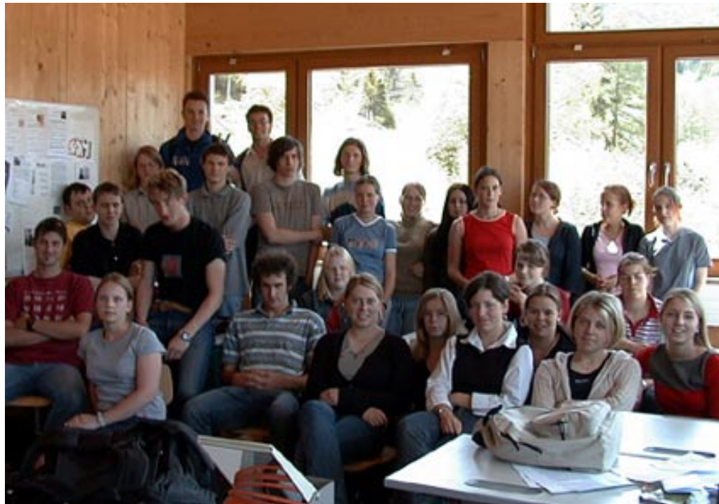
Multi Augustinum St. Margarethen Klassen E2a + E2b